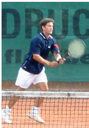
Attraktive Interclubspiele, nicht nur in der NLB und NLC

Mit einer Firmenmitgliedschaft erhalten Sie 2 Spielberechtigungen, so genannte „Spielplättli“ auf ihren Firmennamen . Damit werden Ihre Mitarbeitenden im Rahmen unseres Spielregementes unbeschränkt zum Tennisspielen auf der Clubanlage berechtigt (Ausnahme: sie dürfen mit diesen 2 Plättli auch zu viert ein Doppel spielen. Die Gleichbehandlung zu unseren Vereinsmitglieder ist damit gewährleistet.